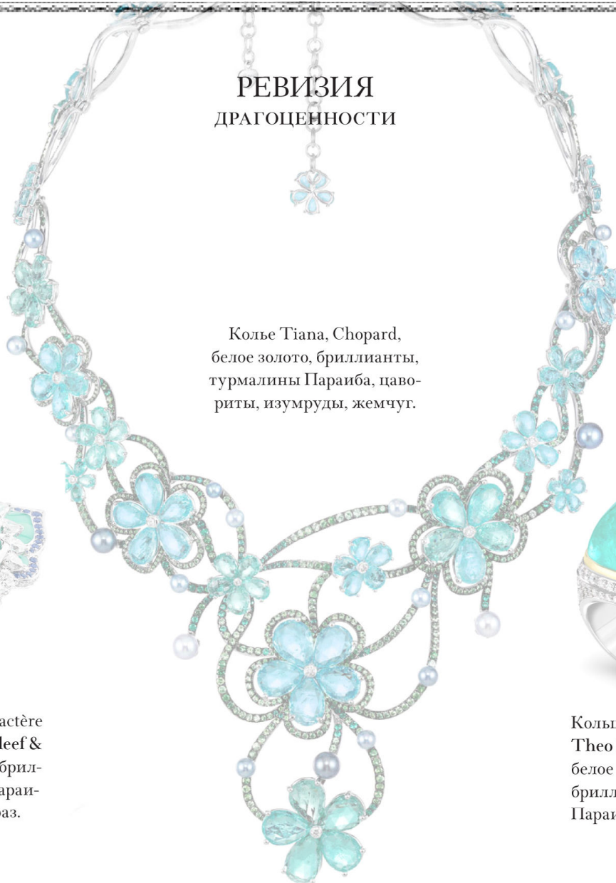
Колье Tiana, Chopard, белое золото, бриллианты, турмалины Параиба, цаво- риты, изумруды, жемчуг.