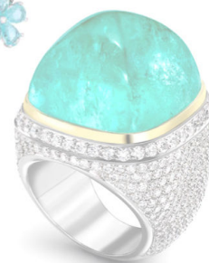
Кольцо Mozambique, Theo Fennell, белое и жёлтое золото, бриллианты, турмалин Параиба.