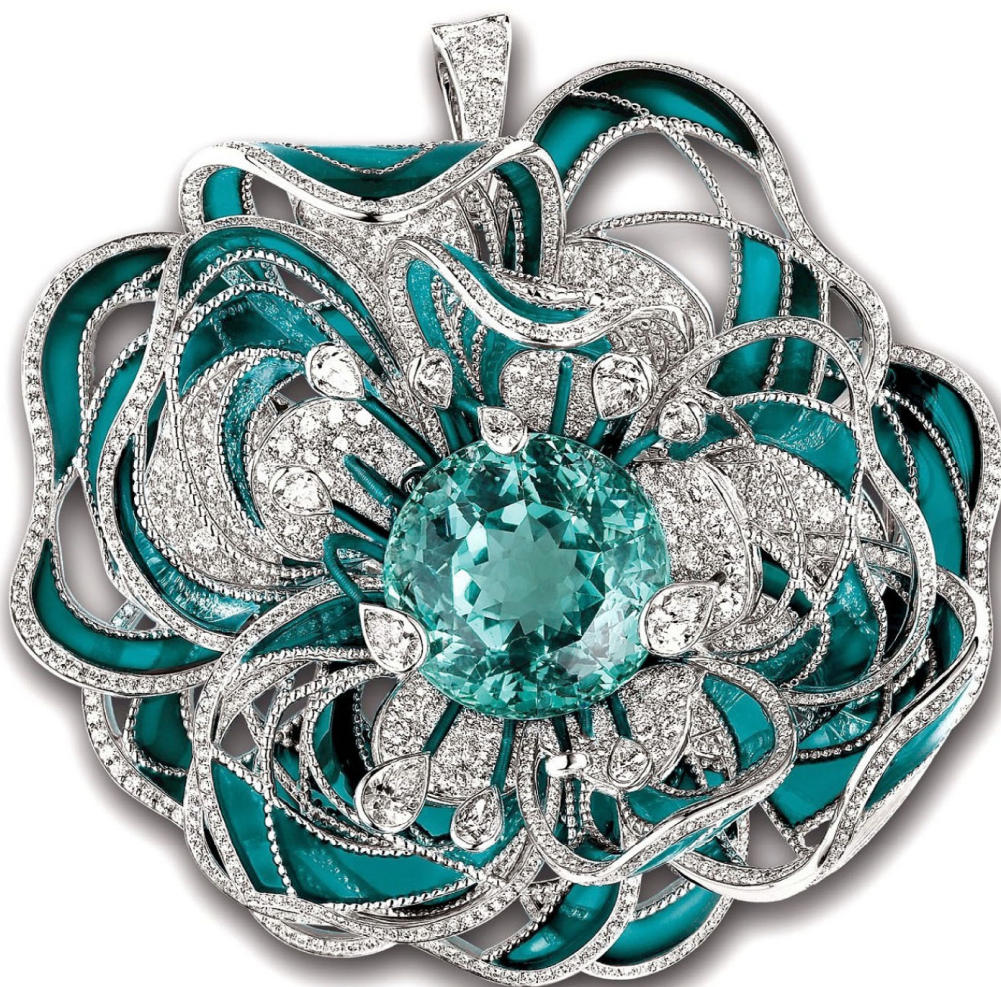
Брошь Camélia Paraiba, Chanel Fine Jewelry, белое золото, бриллианты, турмалин Параиба, эмаль, единственный экземпляр.

Практически сразу после «выхода в свет» турмалин Параиба попал в ранг самых редких и желанных драгоценных камней в мире