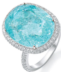
Кольцо Paraiba, Nourbel & Le Cavalier, белое золото, бриллианты, турмалин Параиба.