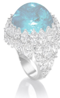
Кольцо Harry Winston, белое золото, бриллианты, турмалин Параиба.

в три карата – большая редкость, среди африканских самоцветов частенько встречаются экземпляры весом более пяти карат. Этот факт вызвал долгие споры о том, что истинными параиба могут называться лишь турмалины бразильского происхождения, а остальные – их подобию. Стоит отметить, что южноамериканское месторождение исчерпало свои запасы, по-