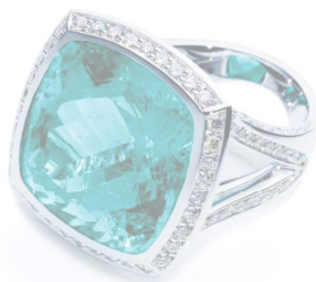
Кольцо Tamara Comolli, белое золото, бриллианты, турмалин Параиба.