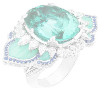
Кольцо Pierres de Caractère Lotus d'Orient, Van Cleef & Arpels, белое золото, брил- лианты, турмалин Параи- ба, сапфиры, хризопраз.